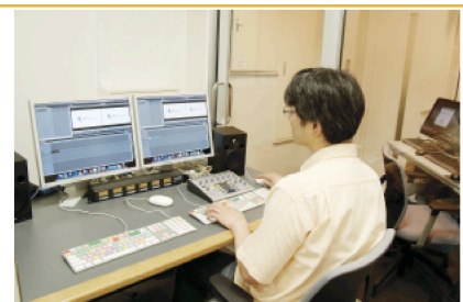
デジタルイズルーム